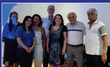
Encontro com Fundação Itaú Pg. 02