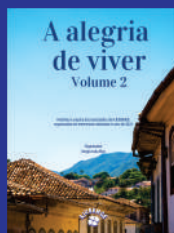
Volume 2 - 2023

Ja está disponível em nosso site o 2º Volume do Livro A Alegria de Viver que reúne as entrevistas de nossos associados realizadas aqui no Jornal da AJUBEMGE. Não perca, acesse o endereço abaixo para baixar os 2 volumes e boa leitura! https://ajubemge.com.br/site2/livro