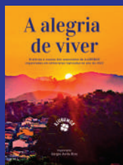
Volume 1 - 2022