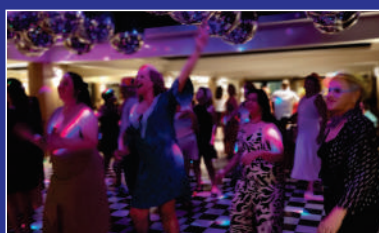
Confraternização AJUBEMGE Pg. 03