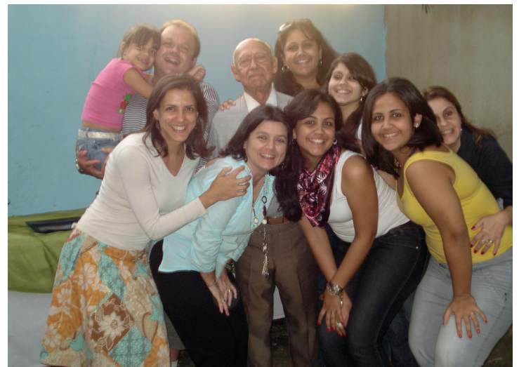
Com a família

Para se ter uma idéia tive muitas oportunidades para ganhar mais, só que para isso eu teria que sair de perto da minha família. Aqui em Belo Horizonte eu me casei tive 6 filhos, sendo que 4 estão vivos e 2 falecidos, tenho 11 netos e 7 bisnetos. Além disso, tenho um sentimento muito grande quando lembro dos meus alunos, foram muitos anos como professor. Pelo lado do banco, acho que o fato de eu saber manter a confidencialidade e