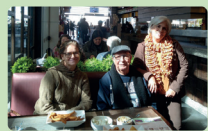
ENCONTRO EM VARGINHA Pág. 2

A origem da celebração no Brasil une jesuítas portugueses, costumes indígenas e caipiras, celebrando santos católicos e pratos com alimentos nativos. Página 4