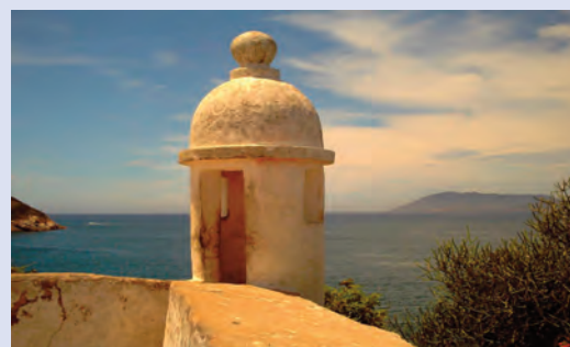
Cabo Frio - RJ

Não perca tempo, entre em contato através do telefone (31) 3201-9423 (Secretaria da AJUBEMGE) e venha fazer parte de mais um grande evento. Aguardamos você!